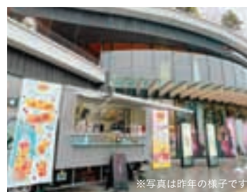
※写真は昨年の様子です

リプトンから話題のフルーツインテアーと限定メニューがキッチントラックで再び登場!リプトン専用タンブラーをお持ちの方は特典がございますのでご持参ください!